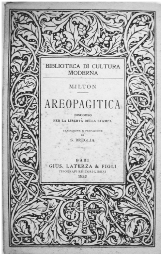
Copertina di J. Milton, Areopagitica. Discorso per la libertà della stampa , Bari 1933

«La libertà ch'io cerco è quella di apprendere, di parlare e di discutere, liberamente e secondo coscienza; questa, più di tutte le altre libertà». Né tale libertà, egli ci assicura, può far paura ad alcuno, perché, per quanto riguarda la stampa, la Verità basterà sempre a proteggersi da sola dagli attacchi dei nemici, e non ha bisogno di inquisizioni e di censure. «Ancorché tutt'i venti della dottrina dovessero essere messi in libertà e correr liberi sulla terra, finché la Verità è sul campo di battaglia, noi le facciamo torto a ricorrere alla censura e ai divieti, perché così mettiamo in dubbio la sua forza. Lasciamo pure che lei e la