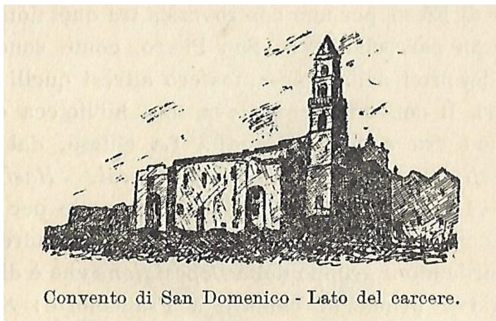
Il convento di S. Domenico di Putignano (incisione tratta da B. Croce, Putignano in Terra di Bari e il maestro d'italiano di Volfango Goethe Domenico Giovinazzzi , Bari 1938)

Il saggio dovette piacere non poco a Giovanni Laterza se è vero che, in omaggio al paese natio, decise poi di ripubblicarlo in un opuscolo dal titolo Putignano in Terra di Bari e il maestro d'italiano di Volfango Goethe (Domenico Giovinazzzi) , che a metà marzo del '38 poté inviare all'autore e a diversi studiosi, in prevalenza tedeschi: impreziosito da incisioni, realizzate sulla base di foto e disegni inviati dallo stesso Laterza a Croce, l'opuscolo – comunque «poco ben riuscito tipograficamente» per ammissione dello stesso editore – oltre alla pianta settecentesca di Putignano riportava tra gli altri anche i disegni dei trulli attraverso i quali si scendeva nelle «grotte di stalattiti del suo territorio, di recente scoperte e rese praticabili» 23 e soprattutto quelli della chiesa e del convento di S. Domenico ( lato del carcere ).