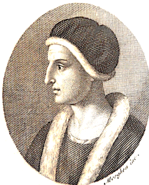
Ritratto dell'umanista Antonio de Ferrariis il Galateo

opponendosi con fermezza alle persecuzioni tentate dagli uomini di chiesa, e sventandole e castigandole, non solo li pregiò come elemento importante nell'economia del paese, ma provò per essi pietà e accoramento e sollecitudine quando dalla Spagna giunsero, in miserrime condizioni, a cercar rifugio nel suo regno, raccomandando ai suoi ministri di usare riguardi per «questi poveri giudei, i quali saprete quanti danni e dispiacimenti hanno patito». 10