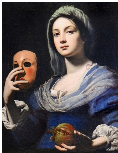
Lorenzo Lippi, Allegoria della simulazione , 1650