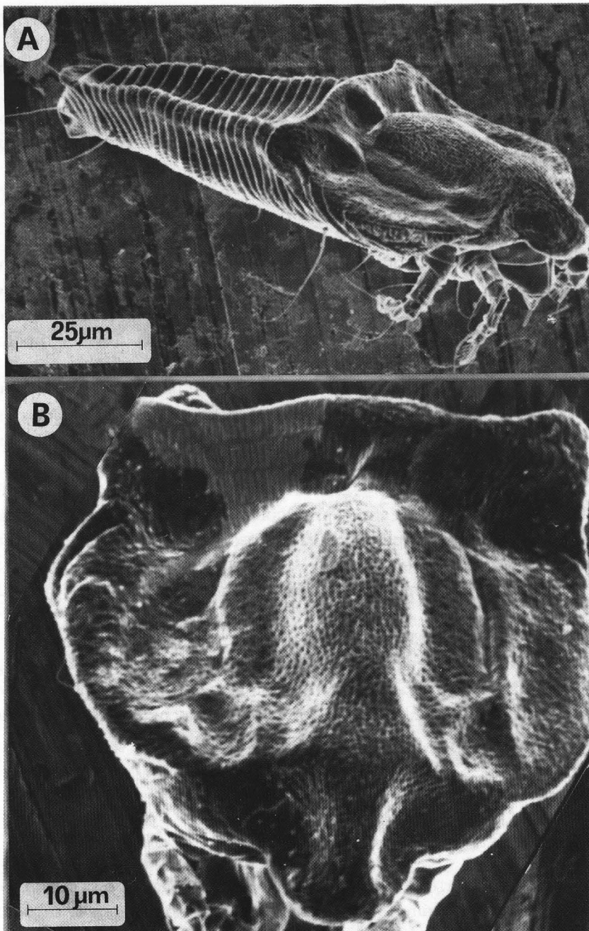
Fig. 2 - Bariella farnei n. sp.: A, adulto visto subdorsalmente; B, scudo dorsale di un adulto.